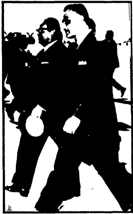
IL CAIRO — Il presidente jugoslavo Tito con Nasser al suo arrivo nella capitale egiziana

«Siamo disposti a sacrificare tutte le nostre risorse per la causa della Palestina» dice El Gheddafi - Tifo si incontra con Nasser