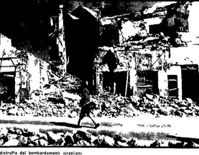
Una veduta della città di Suez distrutta dai bombardamenti israeliani.

NEW YORK 25. Una importante rete televisiva americana ha annunciato oggi che Nixon ha deciso di togliere ai piloti israeliti 25 aerei Phantom e « un certo numero di Phantom ». La CBS ha detto che « il Vietnam è un paese che ha il diritto di organizzarsi a modo suo » e che « amare la libertà significa riconoscere il diritto dei popoli ad organizzarsi a modo loro ».