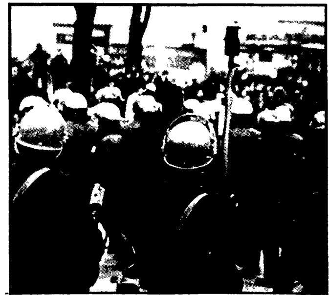
BUFFALO (New York) - Un momento dell'irruzione poliziesca all'Università

Il governatore Reagan accusa l'avvocato Kunstler, difensore dei «sette» di Chicago, di aver fomentato gli incidenti - Spiro Agnew parla di attacco al sistema giudiziario - Violenti scontri anche all'Università di Buffalo