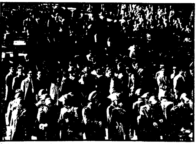
Studenti e il consueto sbarramento di questurini all'Università

La protesta promossa dal sindacato scuola-CGIL e dai docenti subalterni — Prese di posizione contro i rigurgiti fascisti — I docenti e ricercatori di fisica solidali con gli studenti arrestati — Anche ieri aggressioni dei teppisti contro liceali all'«Avogadro» e al «Plinio» — Due giovani ricoverati in ospedale