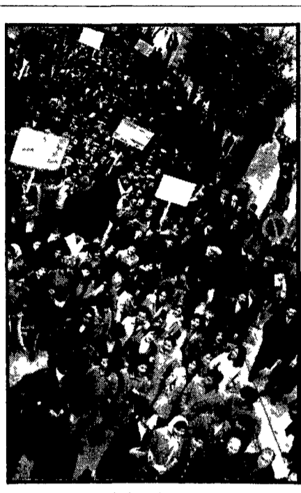
LA PROTESTA DELLA LUCANIA Montescaglioso, un centro della Basilicata in lotta, nei giorni scorsi, per una nuova politica, per le riforme, per la fine dell'emigrazione...»

Offensiva degli agrari e delle destre per vanificare la conquista dei lavoratori