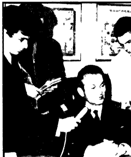
TOLONE - L'ammiraglio Devie Declares nel corso della conferenza stampa nella quale ha annunciato la perdita del sommergibile Eurydice

ne, di cui quattro italiani quattro navi scorta tre sottomarini passano al setaccio questo breve specchio di mare a qualche chilometro appena dal polto di Saint Tropez. In nottata è attesa la nave oceanografica Jean Charcot che si trovava in missione nell'alto Mediterraneo e che è stata richiamata d'urgenza alla base per mettersi a disposizione dell'ammiraglio. Questa nave è dotata di una apparecchiatura ultramoderna destinata allo studio dei fondali marini tra cui un mezzo sommergibile teleguidato, la "troika" che con le sue tre telecamere permette di vedere i fondali e grande profondità. Circa le cause probabili del disastro se da una parte si esclude l'errore di navigazione o il mancato funzionamento delle apparecchiature di bordo, il capitano afferma che il sommergibile è stato colpito da un oggetto di cui doveva incrociare il sottomarino.