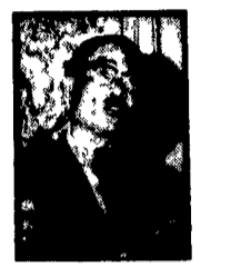
SUFANUVONG - La via della pace