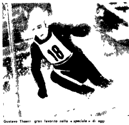
Gustavo Thoeni gran favorito nello «speciale» di oggi