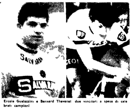
Ercolano Gualazzini e Bernard Thévenet due vincitori a spese di celebri campioni