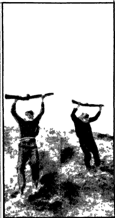
In uno dei campi di addestramento dei guerriglieri palestinesi durante un'esercitazione. Nei giorni scorsi, i partigiani arabi hanno attaccato diverse postazioni degli occupanti israeliani nella Cisgiordania e nella zona delle alture di Golan

MOSCA 13 (TASS) - Negli ultimi tempi vengono diffuse sulla stampa borghese e nei circoli di genti di alcuni stati imperialisti in-