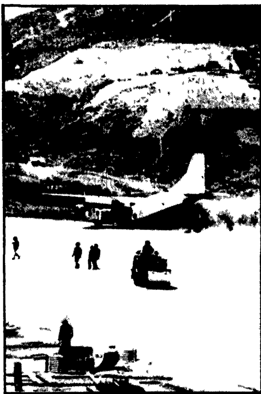
LAOS - La base di Sam Thong da cui partivano «missioni» aeree USA, sarebbe stata occupata dalle forze del Pathet Lao...

Uscito dallo studio ufficiale del Capo dello Stato Fanfani ha fatto pochi minuti dopo la seguente dichiarazione: «Ho riferito al Presidente della Repubblica gli accertamenti che nel corso dell'espletamento del mandato affidatomi il 12 marzo ho potuto fare...»