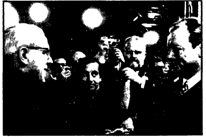
Il cancelliere di Bonn Brandt e il premier della RDT Stoph si sono incontrati ieri a Erfurt. Una grande folla di cittadini e giornalisti ha assistito allo storico avvenimento...

Il gruppo dirigente d.c. e i socialdemocratici responsabili di una crisi politica che si fa sempre più grave