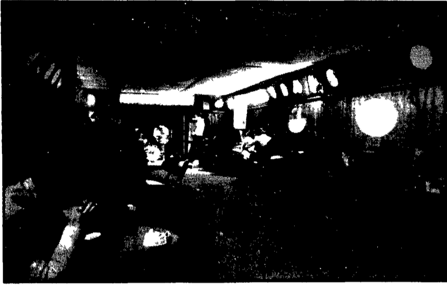
L'interno del «New sporting club», più simile a un bar che a una «fumeria»

Nessuna visita medica per i dieci giovani trovati in stato soporoso - Il quadro terrificante descritto da certi giornali - 800 grammi fra stupefacenti ed eccitanti sequestrati nei locali del circolo - Iniziativa del provveditore agli studi - Il vero problema: perchè?