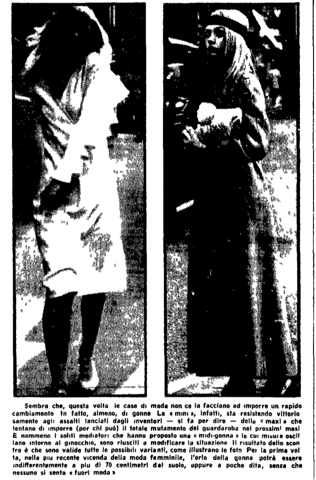
Sembra che, questa volta le case di moda non ce la facciano ad imporre un rapido cambiamento. In fatto, almeno, di genere. La «mini», infatti, sta resistendo vittoriosamente agli assalti lanciati dagli inventori - si fa per dire - della «maxi» che tentano di imporre (per chi può) il totale mutamento del guardaroba nei prossimi mesi... E nemmeno i soliti mediatori che hanno proposto una «midi-gonna» le cui misure oscillano intorno al ginocchio, sono riusciti a modificare la situazione. Il risultato dello scontro è che sono valide tutte le possibili varianti, come illustrano le foto. Per la prima volta, nella più recente vicenda della moda femminile, l'orlo della gonna potrà essere indifferente a più di 70 centimetri dal suolo, oppure a poche dita, senza che nessuno si senta «fuori moda».

NON SANNO SCEGLIERE TRA MINI, MAXI E MIDIGONNE