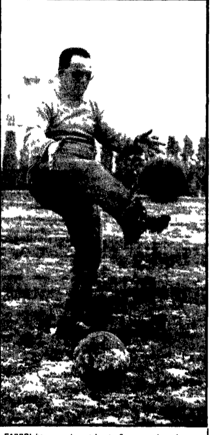
FABBRIO ha un conto aperto con Scopigno domenica cercherà di regolarlo