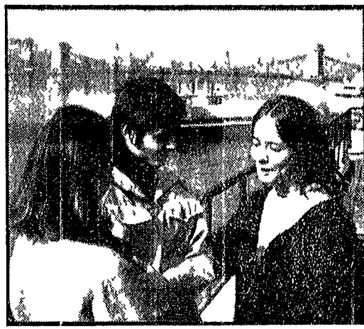
Sulla riva del Danubio