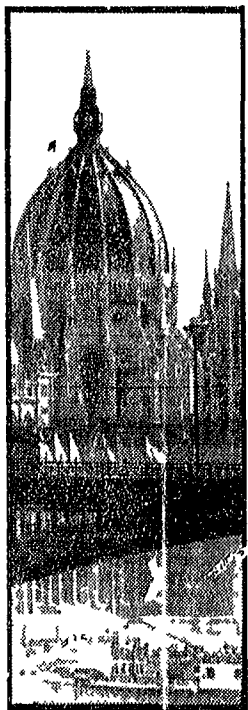
La cupola del Parlamento