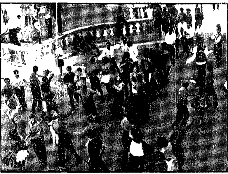
Una scena dal film «Venti lucenti»

di Zoltán Várkonyi per mostrare il carattere estetico di quel rilancio.