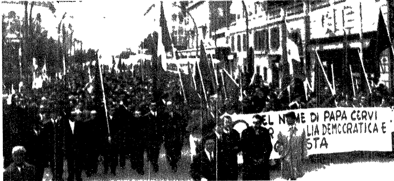
FERRARA — L'imponente corteo di oltre 10 mila persone con cui il PCI ha praticamente aperto la campagna elettorale sfilava in viale Cavour...

Dal convegno dei delegati e dei quadri FIAT rilancio della lotta per le riforme e a livello aziendale