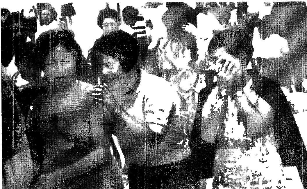
CITTA' DEL GUATEMALA — Drammatici sviluppi della vicenda dell'ambasciatore rapito. Uno dei 22 detenuti di cui le FAR chiedono la liberazione è stato ucciso in carcere...

In circostanze oscure, l'esercito è penetrato con mitragliatrici e mezzi blindati nella prigione ed ha aperto il fuoco sui «politici» - Un morto e sei feriti