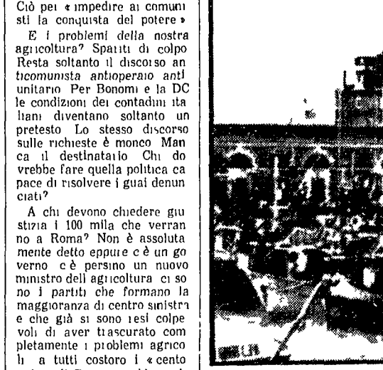
150 motopescherecci, l'intera flotta di Chioggia, hanno fatto la comparsa ieri mattina nel porto di Venezia preceduti dagli stridenti ululati delle sirene.

150 motopescherecci, l'intera flotta di Chioggia, hanno fatto la comparsa ieri mattina nel porto di Venezia preceduti dagli stridenti ululati delle sirene. I pescatori intendevano così protestare per la imminente entrata in vigore del regolamento comunitario anche per la pesca, fatto che metterà in grave difficoltà i 150 mila lavoratori italiani del settore essendo la pesca del nostro paese impreparata ad affrontare la competitività. I pescatori di Chioggia protestavano anche contro la repressione cui sono stati fatti segno in questi ultimi tempi. Nella foto: parte dei pescherecci a Venezia.