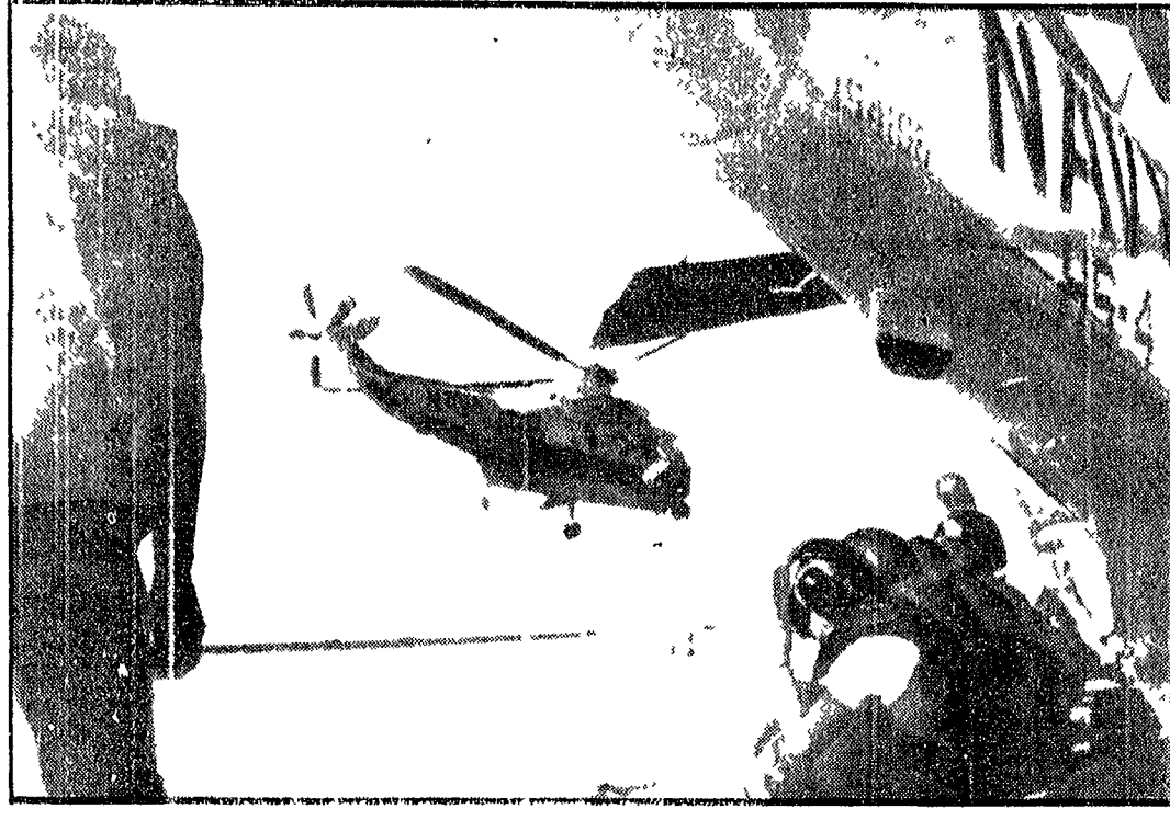
Giunge sulla paratare a Jwo Jima l'elicottero 66, pilotato dal capitano Charles Smiley. È l'elicottero che ha già recuperato le precedenti navicelle Apollo. Ora parteciperà a recupero di Lovell, Haise e Swigert.

«Come diavolo si spezza questo pane di zenzero?» Haise chiede spiegazioni a Terra sul cibo saldato chimicamente - «Se ci lamentiamo per il mangiare, vuol dire che ci sentiamo meglio» - «Questo LEM è troppo affollato»