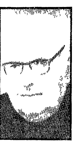
MOSCA 17. La «Pravda» informa oggi che mercoledì 11 (14 di settembre) è morto il compagno Vittorio Codovilla presidente del Partito comunista argentino. Da tempo il valeroso dirigente operaio era sofferente per una grave malattia.

Codovilla nato 18 febbraio del 1894 a Ottobiano in provincia di Pavia emigrò in Argentina nel 1912 a causa della crisi politica subita per la sua attività politica nelle file del partito socialista. Nel 1914 aderì al Partito socialista argentino (PSA) di tendenza in breve tempo il leader dell'ala sinistra socialista. Nel 1916 fu eletto segretario del PSA e fondò un giornale di nome «El Socialista». Nel 1919 aderì al Partito socialista internazionale (PSI) di tendenza in breve tempo il leader dell'ala sinistra socialista. Nel 1919 aderì al Partito socialista internazionale (PSI) di tendenza in breve tempo il leader dell'ala sinistra socialista.