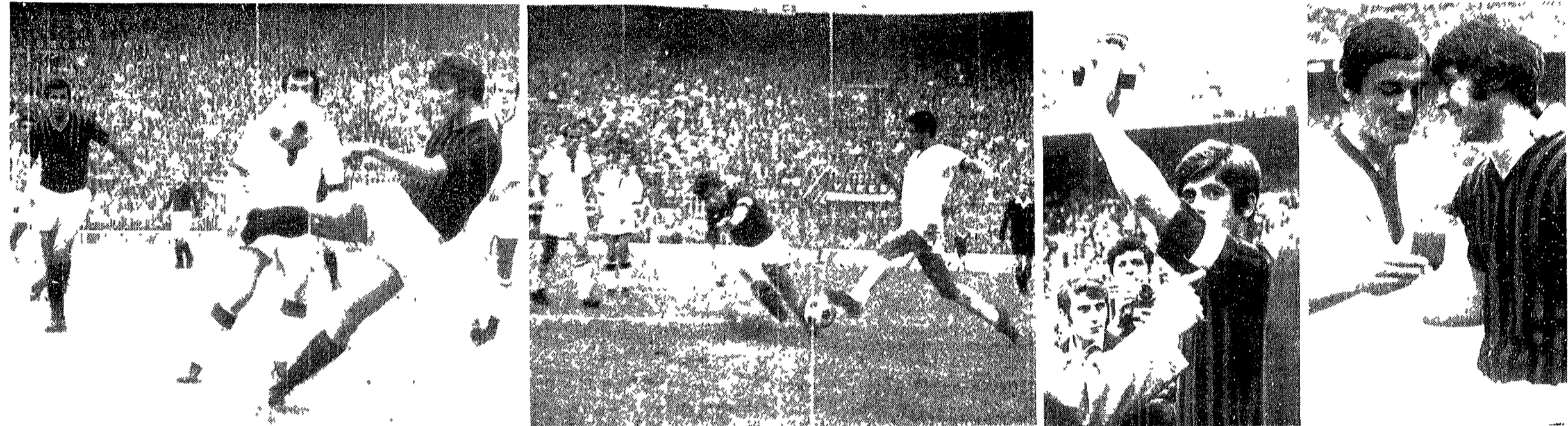
MILAN CAGLIARI — E' stata un po' la partita delle occasioni mancate. Qui vediamo (foto a sinistra) un tiro di Prati che finirà di poco a lato e un intervento di Nene su Rivera lanciato a rete. L'incontro fra rossoblu e i nuovi campioni d'Italia è stato però anche un'occasione per festeggiamenti: la congratulazioni, le premiazioni. Nella terza foto Rivera mostra il «Pallone d'oro» che gli è stato consegnato ieri a San Siro quale «miglior calciatore d'Europa», mentre nell'ultima Prati e Riva, che come tutti gli altri giocatori in campo si sono scambiati reciprocamente medaglie, si congratulano a vicenda.