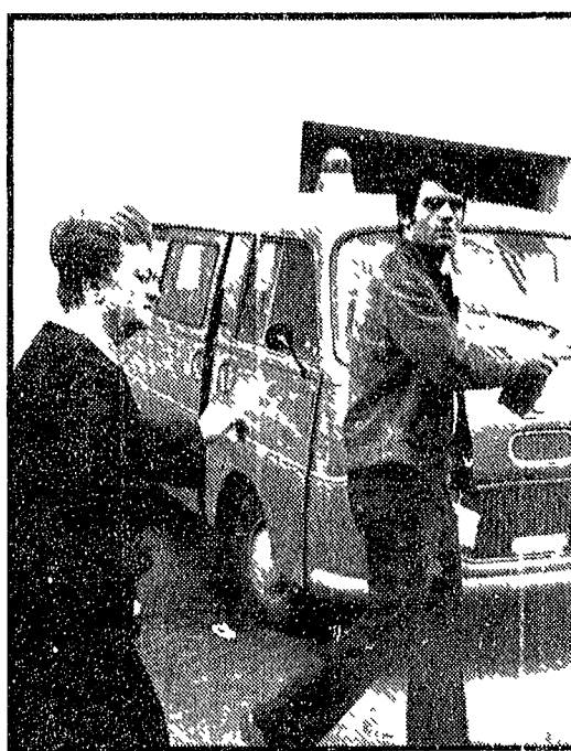
«Non so perchè si è uccisa»

Ha sigillato con il nastro adesivo porte e finestre - Panico nella palazzina sulla via Cassia. Un pensionato ha sigillato con il nastro adesivo porte e finestre della sua casa, che è poi esplosa dopo aver aperto il gas. Il panico si è diffuso nella palazzina sulla via Cassia.