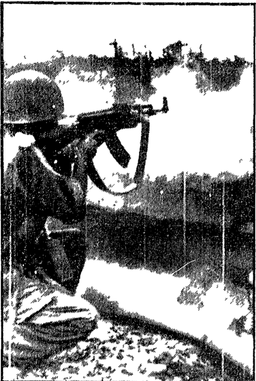
PHNOM PENH — I soldati del regime fantoccio di Lon Nol hanno «riconquistato» la città di Saang, dopo che i patrioti si erano ritirati, impiegando tre ore per percorrere un tratto di 450 metri e vomitando una valanga di bombo sui campi ormai deserti. Nella foto un soldato fantoccio scarica la sua arma contro i fantismi.

I primi tre aerei «mimetizzati» sono giunti la scorsa notte a Phnom Penh — Saang, ormai deserta, «riconquistata» dai fantocci cambogiani — Appello di Sihanouk al popolo — Parigi: le risposte della RDV e del GRP al discorso-truffa di Nixon