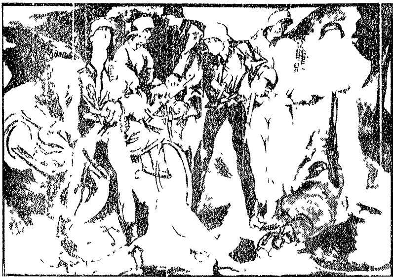
RENATO GUTTUSO dalla serie «Gott mit Uns» 1943-44. Il disegno a inchiostri colorati fa parte di una serie eseguita nei giorni della lotta partigiana a Roma e raffigura il messico delle Fosse Ardeatine. A questa della Guttuso, attivatore di cultura moderna tra Roma e Milano, seguono alcuni capolavori di contenuto comunista: «Fucilazione in compagnia» del '37, «Fuga dal Elna» del '38, «Crocifissione» del '41, alcune nature morte con bucranio e scene di ballate e ma sacre. Con questi capolavori l'arte antifascista esce dalla guerra di Spagna e la guerra mondiale, realizza un profondo rinnovamento nel campo della linea plastica europea. Van Gogh, Picasso, la finestra sul Europa aperta sul pittore. Sei di Torino e cavallo del '30 (Levi), Menzoni, Palaucci, Galante, Cressa e Bravelli) e anche un'opera di nazione internazionale.