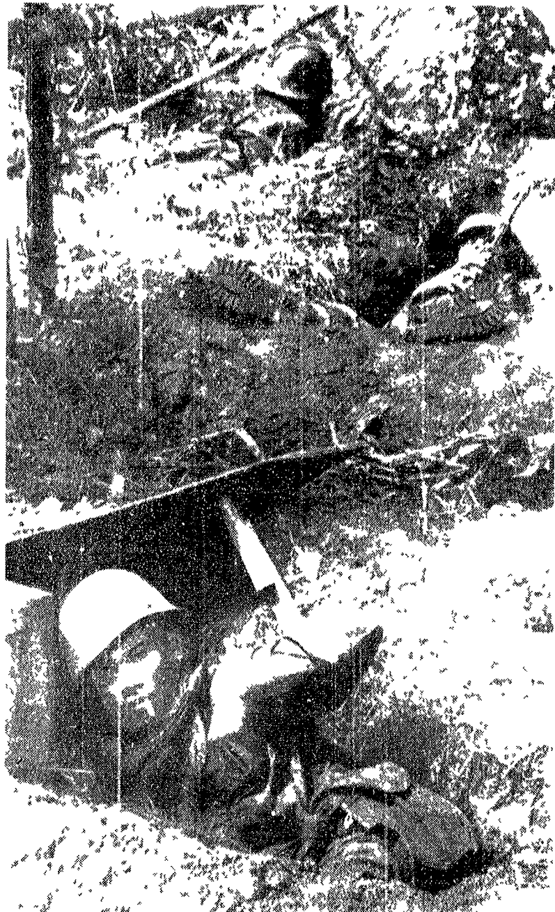
PHNOM PENH - Soldati governativi a seduti nella provincia di Svayng da reparti partigiani sempre più numerosi attendono accovacciati in trincee individuali l'arrivo di rifornimenti dall'aria.