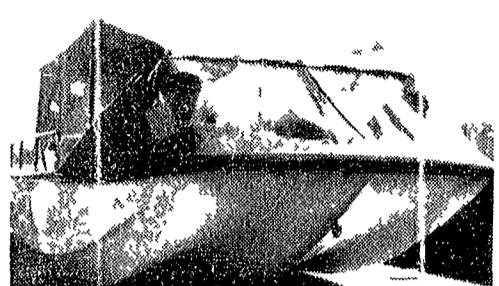
Il «Caravelle 400» può essere dotato di una capottatura impermeabile che ne consente l'utilizzazione anche con cattivo tempo...

E' il primo scafo «sandwich» costruito interamente in Italia - Il suo prezzo è alto, ma notevolmente inferiore a quello di «barche» analoghe di costruzione straniera