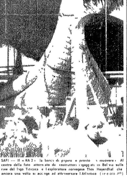
SAPF — Il «RA 2», la barca di piombo e pronto a muoversi. Al centro della foto attorno ai costruttori e i ragazzi in Bolivia sulle rive del lago Titicaca e l'esplosore norvegese Thor Heyerdahl che ancora una volta si accinge ad attraversare l'Atlantico (19 e 20 aprile)