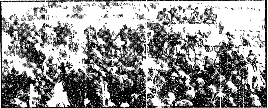
Truppe di Saigon ammassate al confine tra il sud Vietnam e la Cambogia

Il Pentagono annuncia la partecipazione dell'aviazione e di unità di terra americane - Migliaia di soldati sudvietnamiti sono penetrati nell'interno del Paese - Fulbright: «E' un grande errore e una grande scalata» - Oggi Nixon parla alla radio e alla televisione