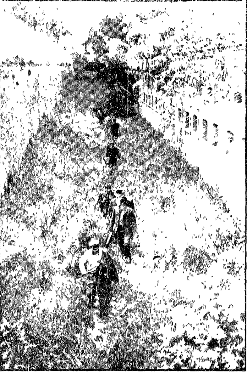
Vigili del fuoco conducono le ricerche del bambino all'interno dell'oratorio salesiano Don Bosco