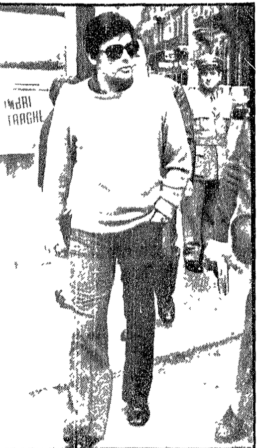
Alain Delon a Roma, la foto lo ritrae mentre passeggia in via del Corso. Nessuna congiura, a quanto pare, è scalfata contro di lui. Delon, appena qualche giorno fa, denunciò in una clamorosa lettera aperta indirizzata al premier Francesco Giuseppe Pompidou come alcuni alti funzionari della Smele avessero deciso di « mazzare » facendogli mettere della droga nei bagagli per non arrestarlo. Ma alcuni giornali francesi hanno ventilato l'ipotesi che l'attore abbia cercato solo un po' di pubblicità gratuita, dandosi l'aireole del perseguitato per la famosa « vicenda » Maitkovic.