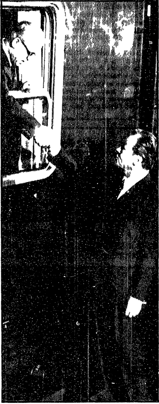
Stretta di mano di congedo a Kassel fra il Presidente del Consiglio della RDT Stoph (sul treno) e il cancelliere Brandt dopo il secondo « vertice » fra i due capi di governo