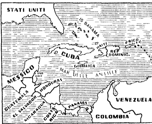
STATI UNITI CUBA HAITI SANTO DOMINGO... MESSICO GUATEMALA HONDURAS COLOMBIA