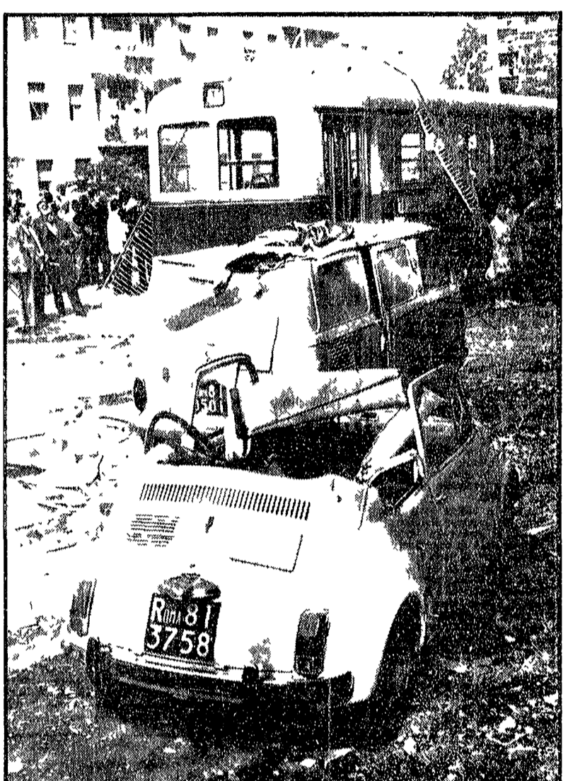
Un'auto distrutta dalle macerie piombate in strada dall'appartamento saltato in aria

Il gas come una bomba è esplosa completamente l'appartamento al settimo piano di un edificio di via... La tragedia è avvenuta alle 7.30 di sera in un appartamento al settimo piano di un edificio di via... Completamente devastata l'abitazione al settimo piano. Salva per caso la sorella della vittima. Le macerie, piombando in strada, hanno distrutto due auto e ferito alcuni passanti.