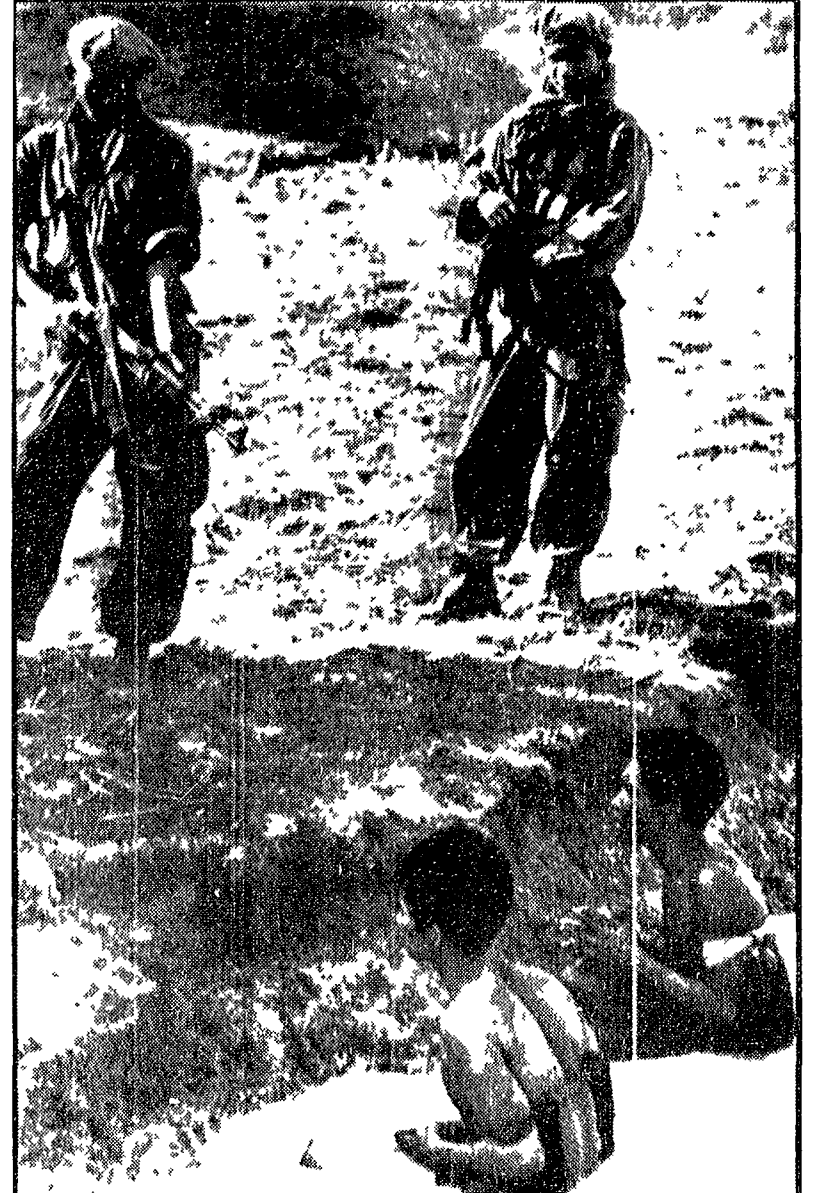
CAMBODIA - Mercenari di Lon Nol armati dagli americani e finalizzati dalla propaganda imperialista tengono sotto la mira dei fucili due contadini cambogiani...