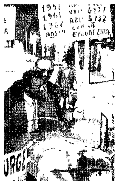
Il mercato di Fiumicino. In alto: un camion di latte. In basso: un camion di carne.