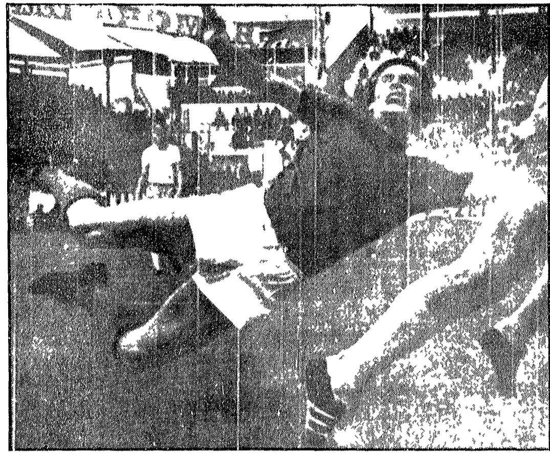
RIVA e finalmente a bocca asciutta ma non è tanto colpa sua quanto di tutta la squadra azzurra che ha rinunciato completamente ad attaccare, accontentandosi del pareggio

ITALIA Albertosi, Burginich, Facchetti, Bertini, Rosato, Ce... URUGUAY Mazurkiewicz, Ubina, Molas, Anchea, Mujica, Castillo, Cortes, Mainero, Cubillo, Esparrago, Bareno