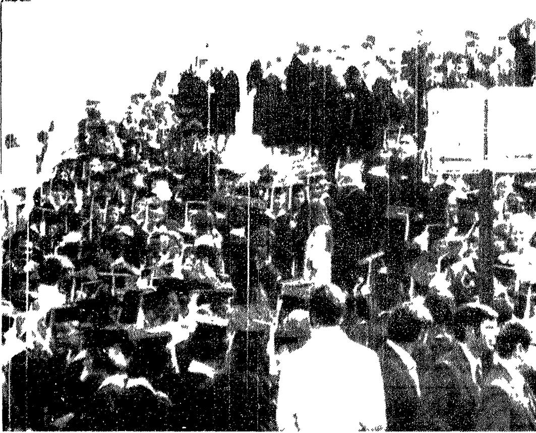
KENT - Assemblea di studenti davanti all'Università Larea arborea, a sinistra della telefono AP e stata teatro lo scorso mese del massacro, compiuto dalla guardia nazionale dell'Ohio, in cui con e noto vennero assassinati quattro studenti che protestavano contro la aggressione alla Cambogia