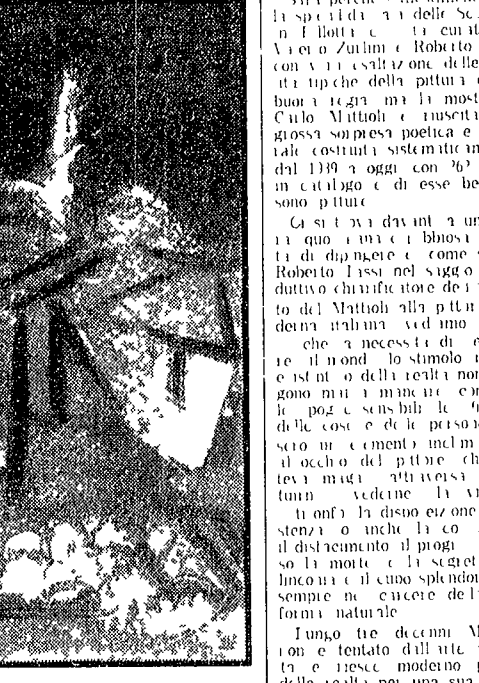
Carlo Mattioli «Paesaggio», 1969

Riscoperta di un artista che riesce moderno pittore della realtà con una tipica immersione, sensuale e tragica, nella vita quotidiana