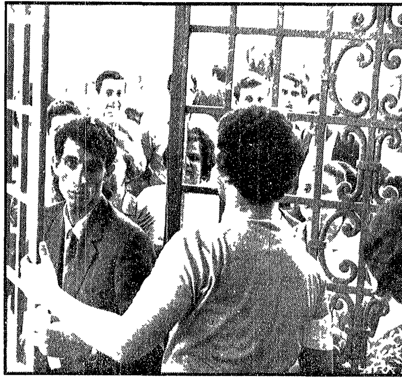
Per protesta lasciano l'ospedale

Un brutto colpo per l'accusa della perizia tecnica sulla 500 di Valpreda. Il giudice ha concluso che l'utilitaria del ballerino era stata sottoposta a una perizia che aveva accertato che la vettura non poteva far su e giù tra Roma e Milano. Ricostituito il comitato di perizia, il giudice ha deciso di rinviare il processo a novembre.