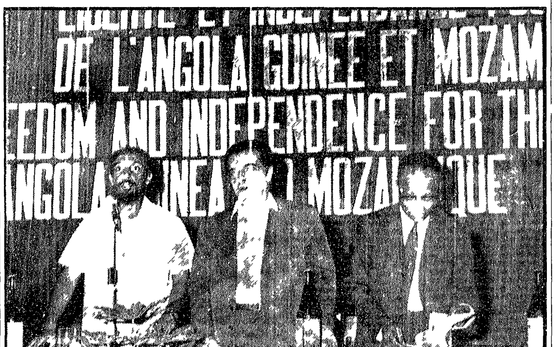
Un aspetto della presidenza della Conferenza di solidarietà con i popoli delle colonie portoghesi

Il capo del partito radicale aumenta ancora i voti rispetto al primo turno