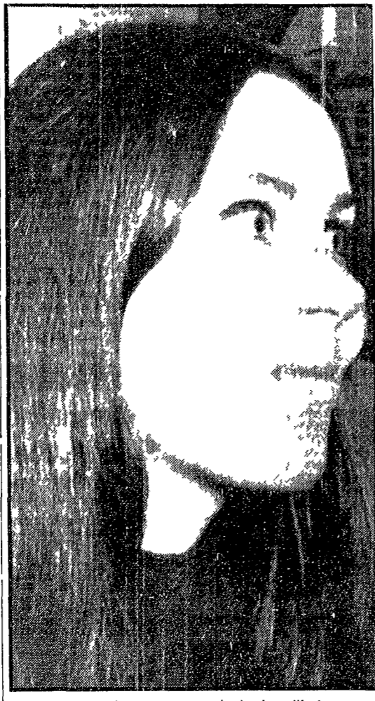
La ragazza americana rimasta carbonizzata nell'auto

La sciagura all'alba a Testaccio - La 600 ha preso fuoco prima di schiantarsi contro un guard-rail - Il giovane che guidava è riuscito a salvarsi con l'aiuto di un poliziotto - Prigionera delle lamiere contorte la ragazza è rimasta carbonizzata