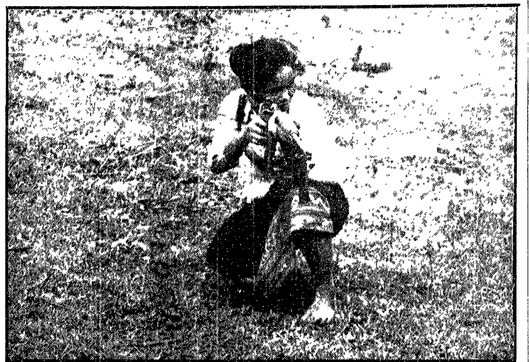
IL VOLTO DEL LAOS Un inviato speciale dell'«Unità», il compagno Emilio Sarzi Amadé, ha raggiunto la zona libera del Laos per un'inchiesta sulla lotta di questo popolo contro l'aggressione americana. La foto che pubblichiamo fa parte di un ampio servizio fotografico — realizzato dal compagno Sarzi Amadé — che accompagnerà l'inchiesta di cui inizieremo la pubblicazione lunedì.

CGIL, CISL e UIL: le divergenze investono la volontà politica del governo e la sostanza delle richieste di riforma