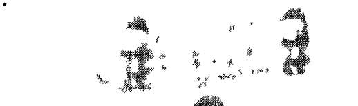
Giacomo Agostini ha riconfermato a Francorchamps la sua superiorità mondiale nella classe 500 cc.