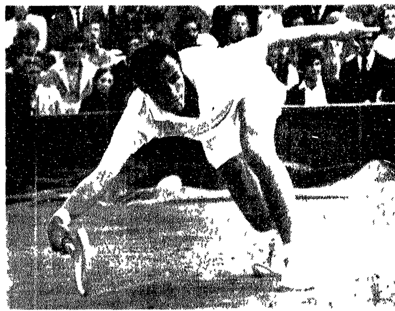
WIMBLEDON — L'austriaco John Newcombe, vincitore del singolare impegnato in una fase della finalissima di sobra contro il connazionale Ken Rosewall da lui battuto in 5 partite

L'anziano Rosewall è stato battuto in cinque set