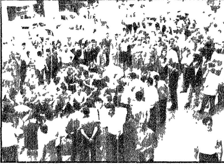
Dopo 16 giorni di serrata la «Fondazione Piaggio» ha riaperto ieri mattina il cantiere navale di Palermo. La revoca della serrata — che costituiva una vera e propria marcia indietro — non rappresenta che il primo passo verso la normalizzazione della situazione nei cantieri, tanto che la lotta degli operai e degli impiegati continua. Nella foto una manifestazione dei cantieristi.