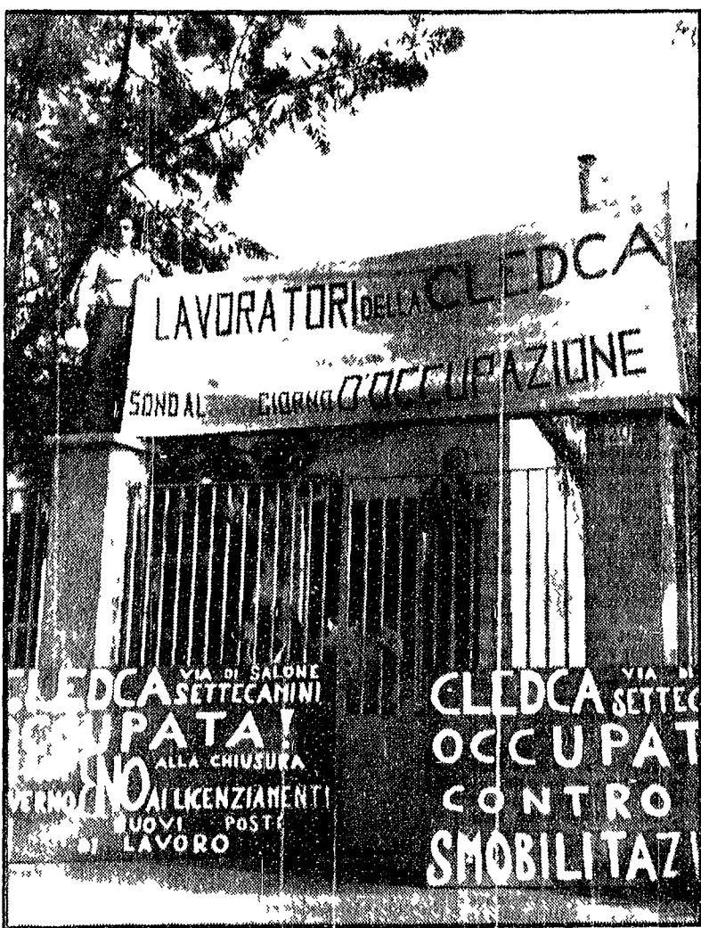
Gli operai della Cledca al ventesimo giorno di lotta davanti ai cancelli della fabbrica occupata a Salone Settecamini di Roma

Lavoratori di tutte le categorie manifesteranno contro l'intransigenza padronale e la crisi di governo - L'iniziativa promossa anche dalla Vegetastampa, Cledca, Pozzo è stata raccolta dalla Fiom, Fim e Uilm - Appello ai partiti democratici - Cantieri deserti per il rinnovo del contratto