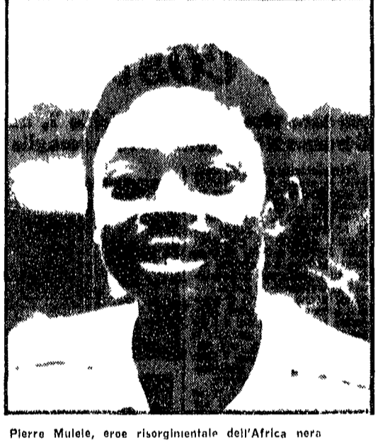
Pierre Mulele, eroe risorgimentale dell'Africa nera

Dal nostro inviato BRAZZAVILLE 17 luglio Il Congo è affogato nel mare di una disgregazione mai conosciuta. L'ultima volta che si è visto un Congo unito è stato nel 1960, quando il paese è stato proclamato indipendente. Ma da allora, il Congo è stato diviso in tante parti, e in ogni parte si è visto un Congo diverso.