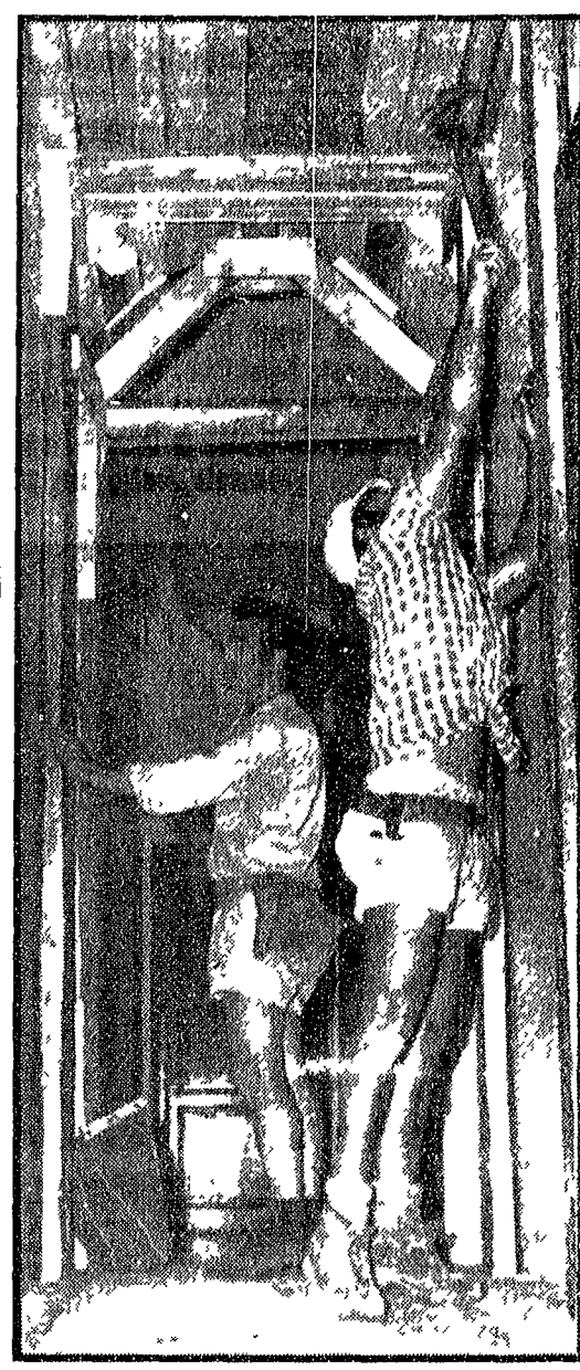
NELLA FOTO operai puntellano uno degli appartamenti

MENTRE sono iniziati i lavori di puntellano negli stabili lesionati sull'Appia Nuova, altre undici famiglie sono state sgombrare dalle loro abitazioni, salgono così a 17 gli appartamenti evacuati. La decisione presa venerdì sera, è stata attuata ieri mattina allontanamento temporaneo, dice l'ordinanza della XV Ripartizione del Comune.