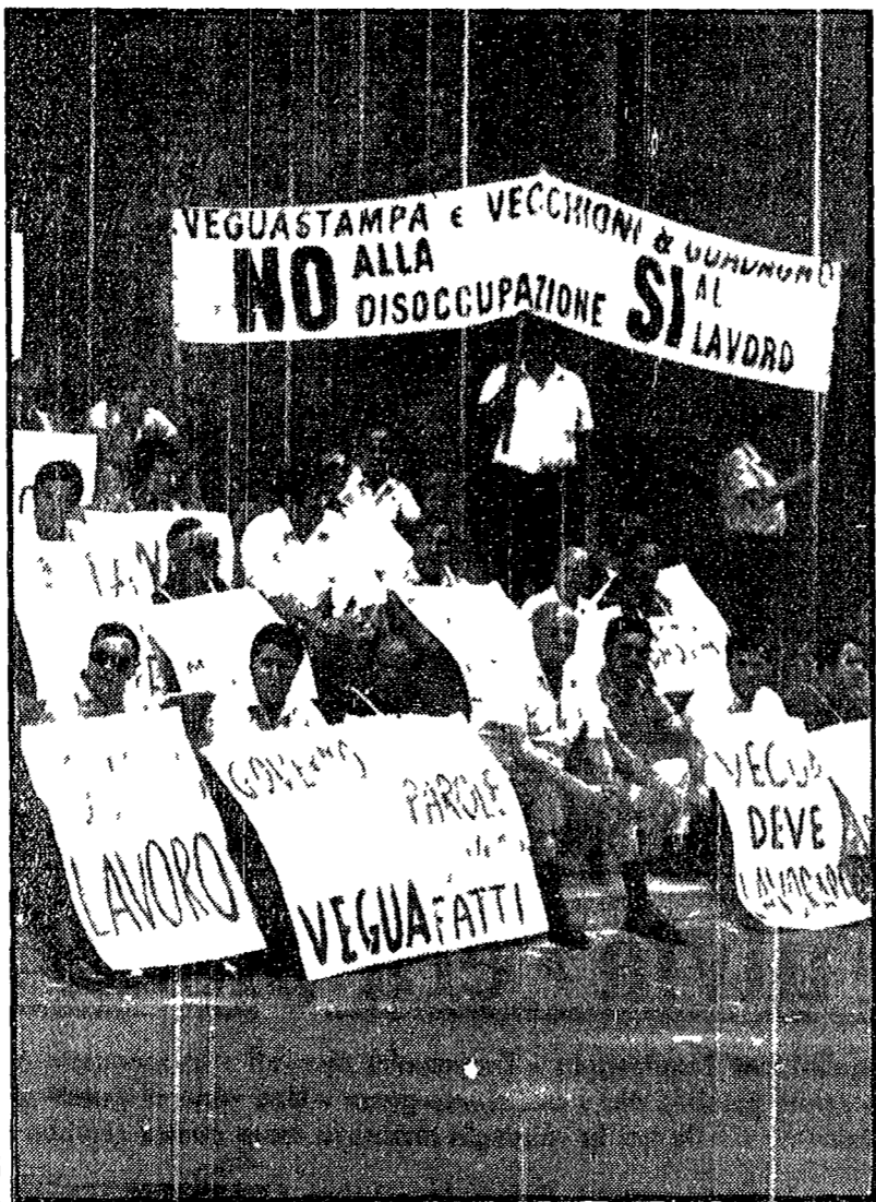
Il picchetto della Veguastampa davanti al ministero dell'Industria

Tutte le aziende metalmeccaniche saranno bloccate dai lavoratori in appoggio alla lotta dei dipendenti della fabbrica sull'Anagnina - La direzione tende a rinviare la soluzione della vertenza - Autolinee: domani sciopero di tre ore