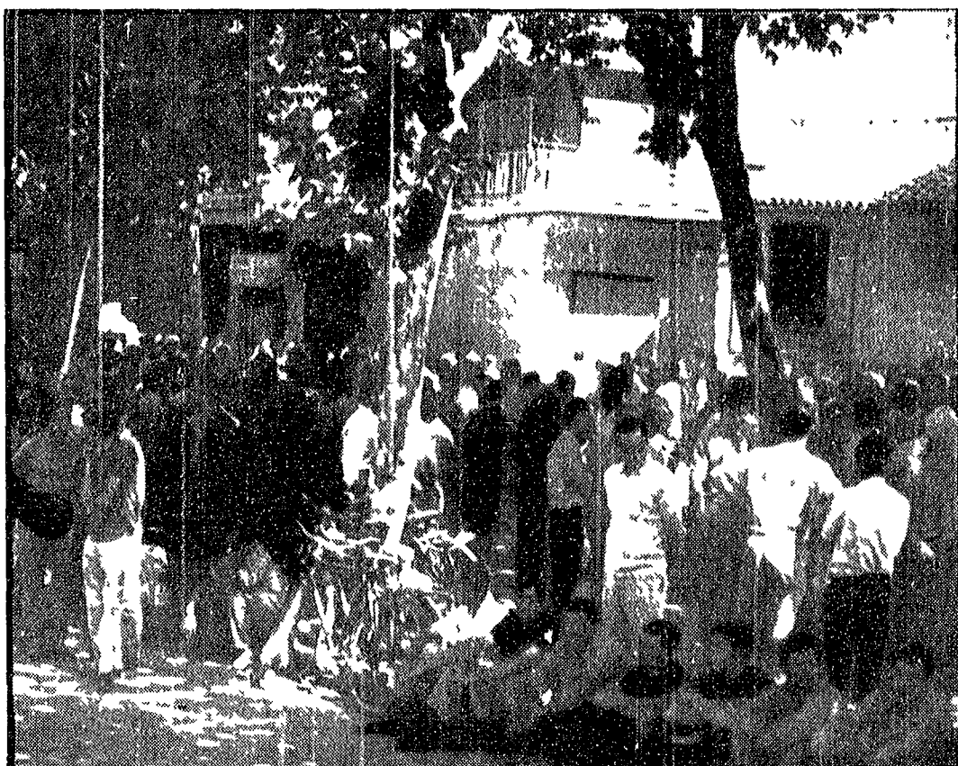
GRANADA — Un momento della manifestazione degli edili davanti alla sede del « sindacato » franchista. Tra pochi istanti, la polizia aprirà il fuoco

Le rivelazioni sull'invio di armi da parte dell'Italia al governo sudaficano hanno provocato una serie di reazioni da parte dei sindacati italiani. Il Cisl e l'Uil, in un telegramma inviato al ministro degli Esteri, si sono dichiarati « sollecitati a denunciare la condotta del governo italiano che, con la sua politica di amicizia e di collaborazione con la Sudafrica, non dovrebbe col-