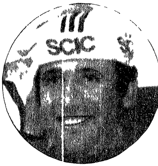
● POLIDORI dopo tante delusioni finalmente un trionfo

Nella foto in alto la TAR TAGNI con il CT azzurro Riodolfi al termine degli ultimi « mondiali » al quali l'azzurra si classificò terza