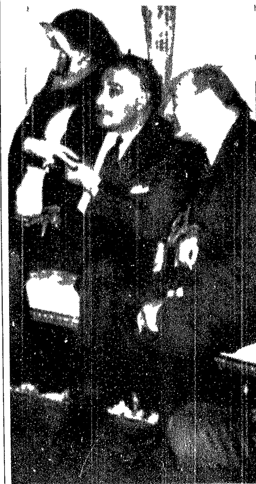
IL CAIRO — Il Presidente della RAU Nasser a colloquio con il ministro della Guerra Riad...