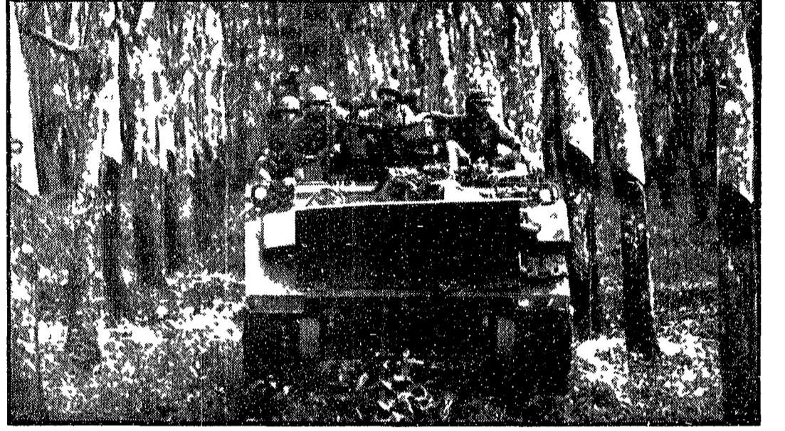
KOMPONG CHAM (Cambogia) - Truppe motorizzate collaborazioniste sud vietnamite muovono attraverso una piantagione di gomma

Missione americana presso i fantocci di Bangkok