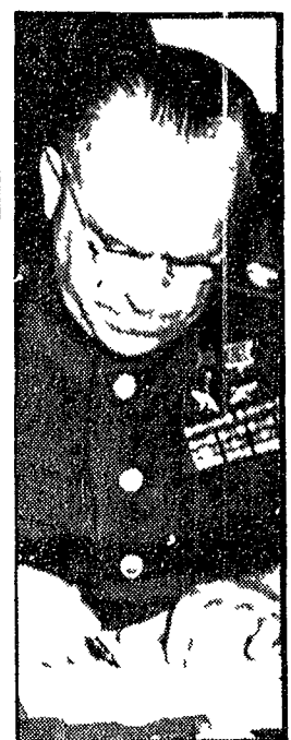
Il maresciallo Zukov firma l'atto di resa senza condizioni della Germania nazista